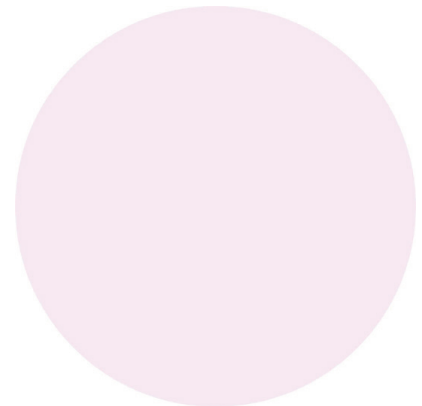
Simone Feuerstein Finanzen